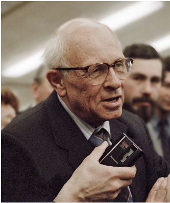
Andreï Sakharov en 1989

force d'attraction apparait entre les deux particules de la même façon que les forces de Van der Waals, mais sur une échelle beaucoup plus grande. Toutefois, cette voie ne permettait pas de rendre compte mathématiquement de la formule de la force. Il est possible que ces calculs reposent sur des bases trop simplifiées.