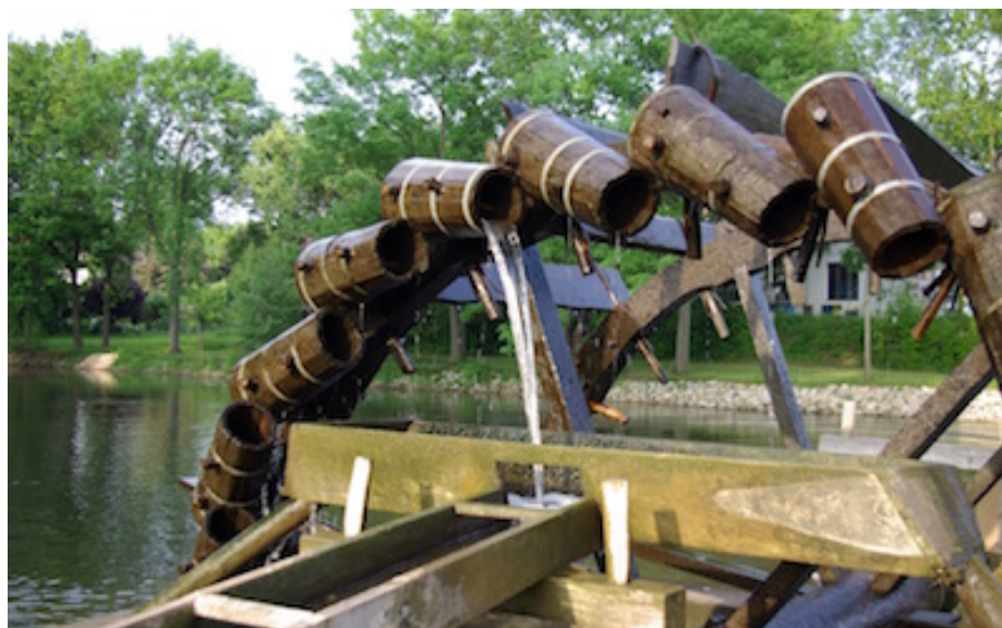
Une noria ou roue à godets, sur la rivière Regnitz, à Erlangen en Bavière, Allemagne.

De façon analogue, Planck ne considérait pas l'échange par quantités finies comme la quantification de la radiation elle-même par nature, et il faut insister sur ce fait peu connu. Il pensait que c'était juste le procédé employé par la matière. C'est Einstein en 1905 qui reprit l'idée des paquets d'énergie finie pour les placer au rang d'éléments constitutifs de la lumière elle-même (nommés photons par la suite), proposition qui sera le début de l'élaboration de la physique quantique.