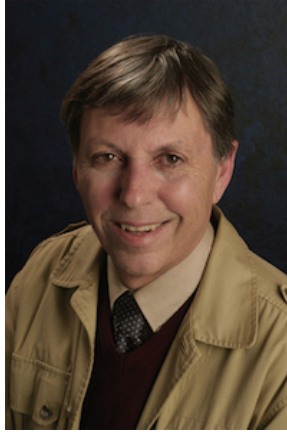
Bernhard Haisch

Ils ont calculé que la force de résistance qui apparaît dans la molécule est proportionnelle à l'accélération de la particule. C'est conforme à la seconde loi de Newton.