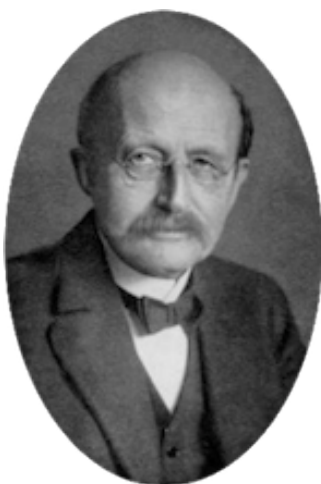
Max Planck (1858 - 1947)

Pour mieux comprendre la différence entre une émission continue et une émission par paquets, je propose l'image d'une roue à godets (noria) placée dans un courant d'eau. Elle recueille l'eau de la rivière dans des godets et déverse leur contenu dans un conduit de distribution. Elle déverse donc l'eau par quantités finies, le volume d'un godet. Pourtant cela n'implique pas que cette segmentation par quantités finies soit dans la nature même de l'eau qui reste un courant continu avant et après ce prélèvement.